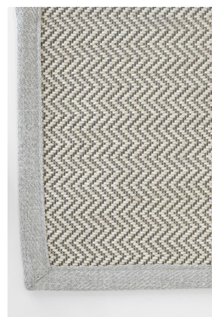
HB 322 Grigio Chiaro