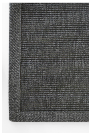
BU 140 Grigio Scuro