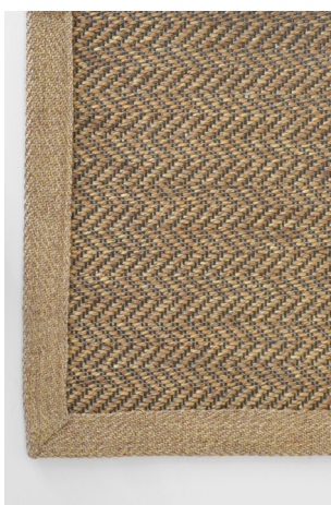
HB 316 Beige