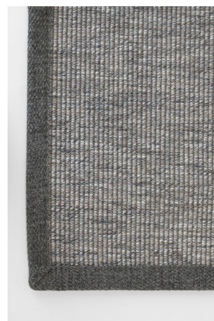
BU 172 Fumo