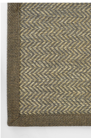
HB 366 Foresta