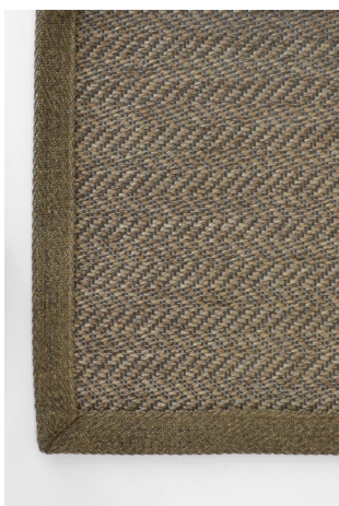
HB 331 Greige