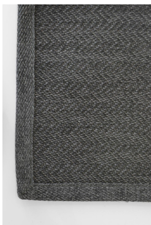
HB 340 Grigio Scuro