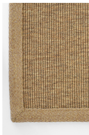
BU 116 Beige