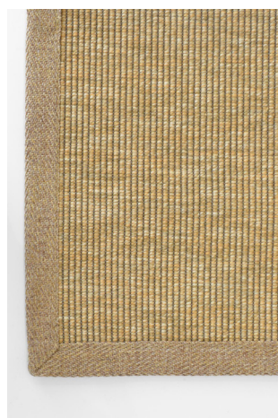
BU 114 Miele