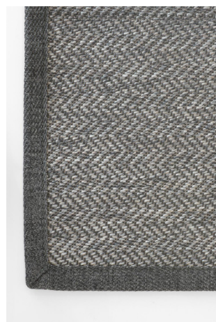
HB 372 Fumo