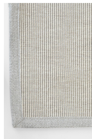
BU 122 Grigio Chiaro

I dati forniti in questa scheda tecnica sono aggiornati al momento della pubblicazione. Carpet Edition si riserva il diritto di modificare materiali, dimensioni e caratteristiche senza preavviso. The data provided in these technical specifications are up to date at the time of publication. Carpet Edition reserves the right to modify materials, sizes and characteristics without notice.