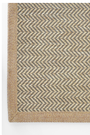
HB 312 Corda