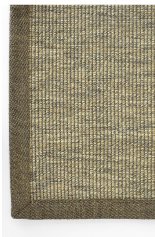
BU 166 Foresta