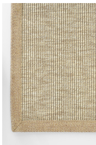
BU 112 Corda