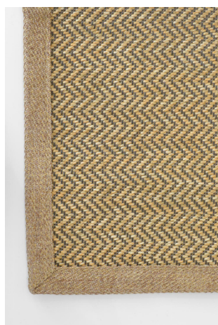
HB 314 Miele