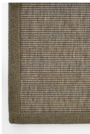
BU 131 Greige